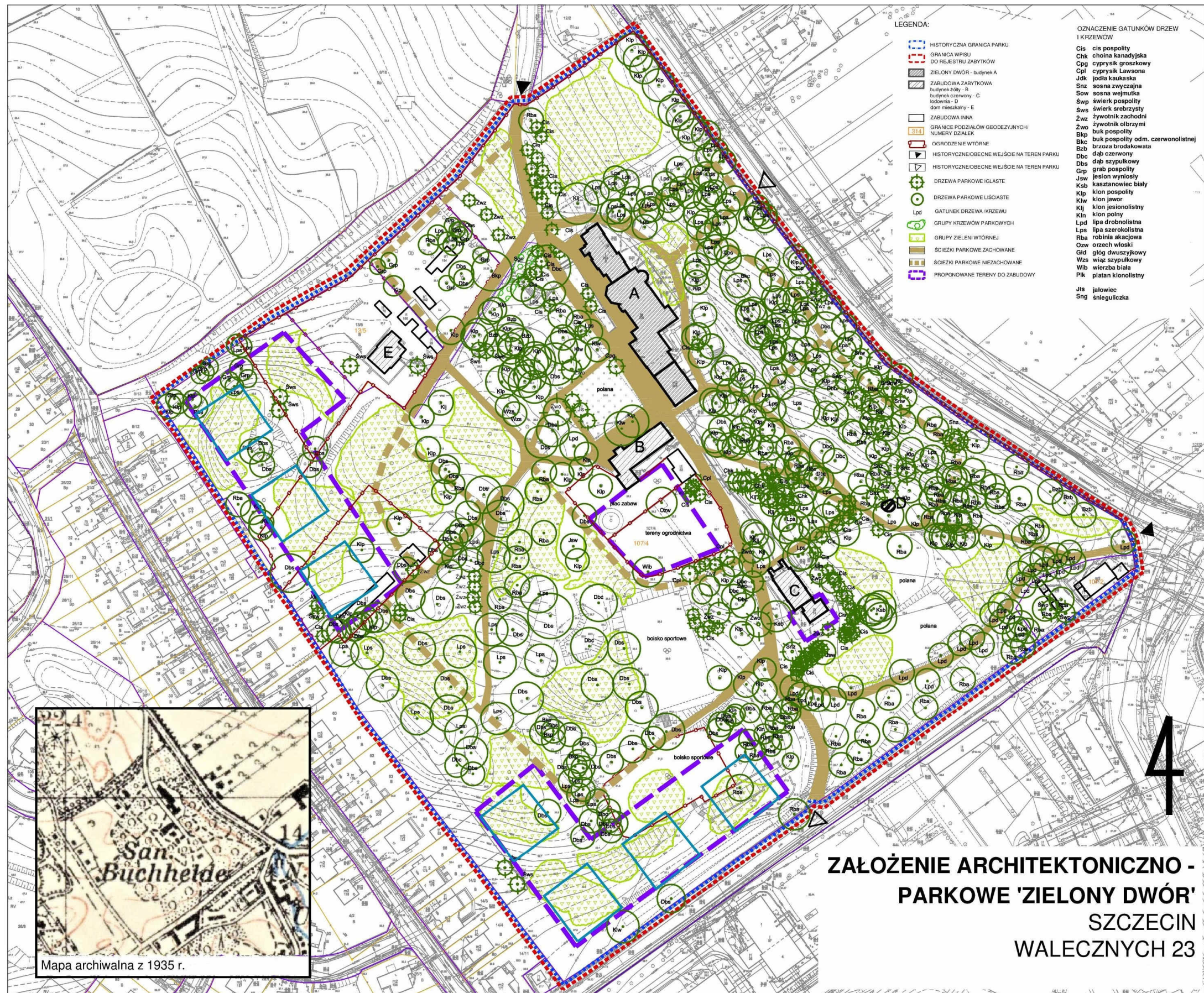
Załącznik 1: Lokalizacja obszarów nowej zabudowy na tle inwentaryzacji dendrologicznej terenu (opracowanie własne)