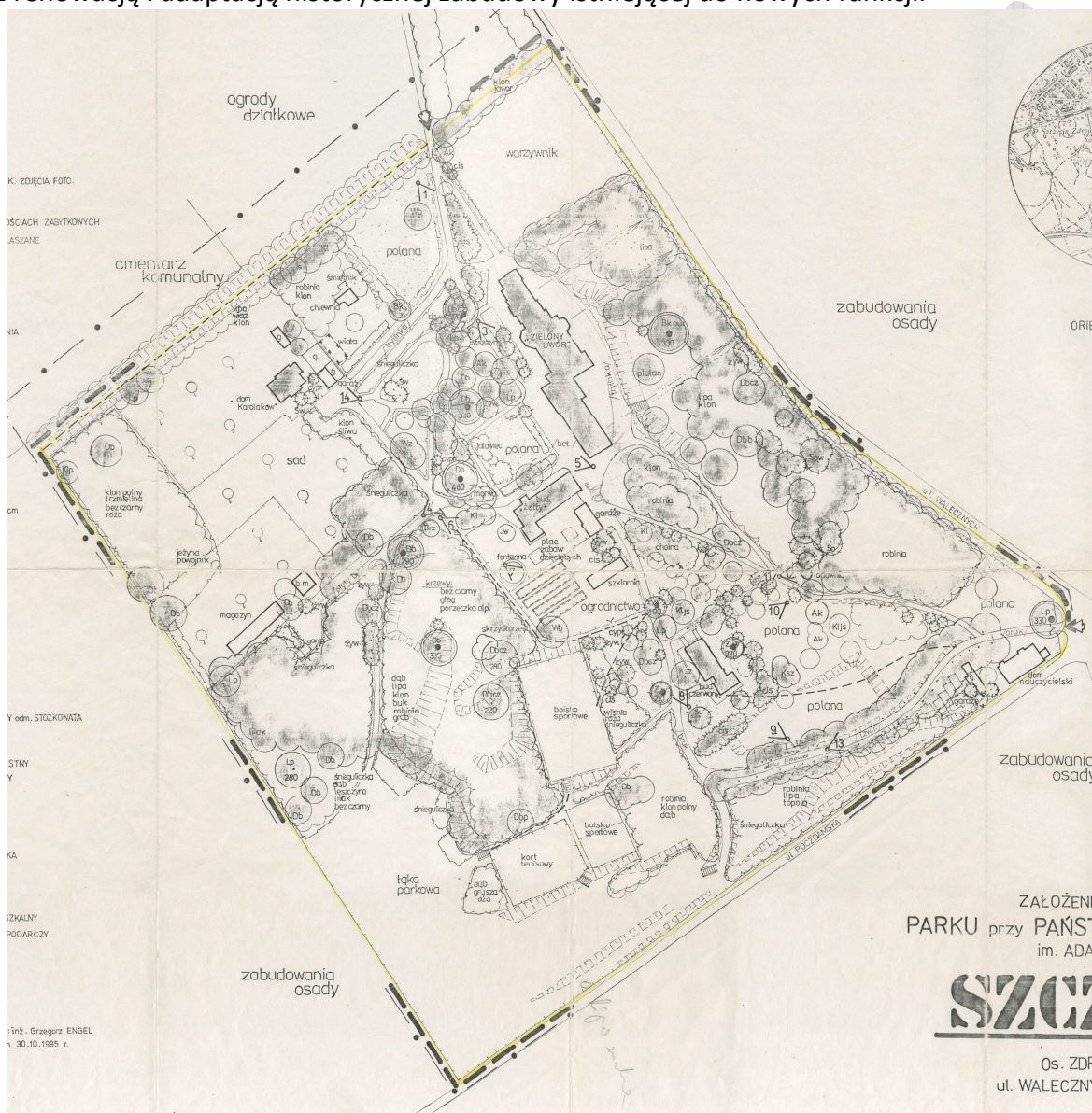
Rysunek.1 Plan założenia przestrzennego założenia dworsko-parkowego Zielony Dwór (Dokumentacja ewidencyjna założenia z 1995 roku)

W granicach obszaru planu znajduje się obiekt wpisany do rejestru zabytków województwa zachodniopomorskiego (pod nr 907): założenie architektoniczno – parkowe dawnego domu sierot w Zdrojach przy ul. Walecznych 23. Ochronie podlega historyczne zagospodarowanie terenu, w tym: kompozycja i skład zieleni parkowej oraz budynki: „Zielony Dwór”, „Dom Karolaków”, „budynek żółty”, „budynek czerwony” i dawna lodownia. Niezbędna jest kompleksowa rewaloryzacja terenu założenia parkowego wraz z renowacją i adaptacją historycznej zabudowy istniejącej do nowych funkcji.