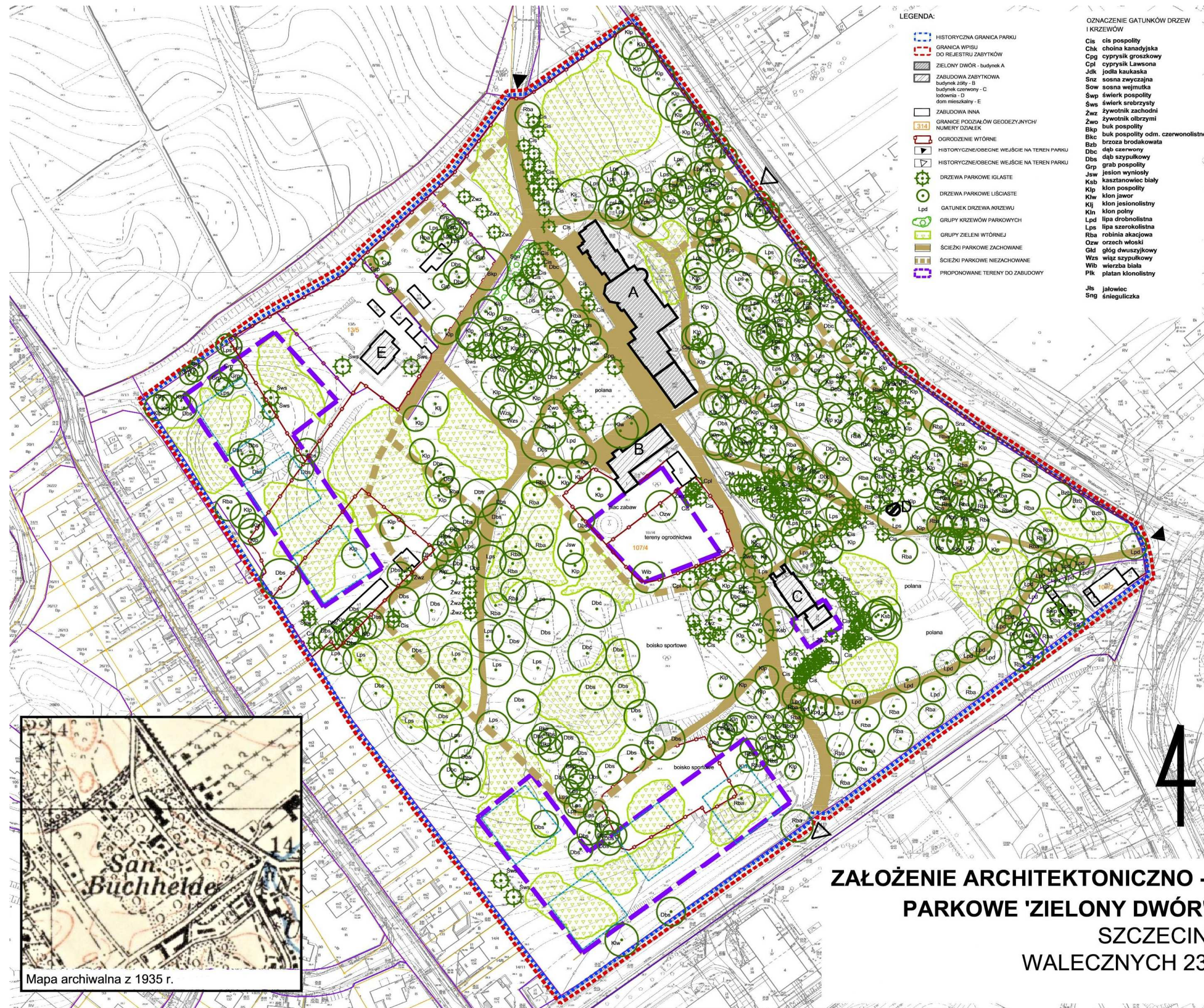
Załącznik 1: Lokalizacja obszarów nowej zabudowy na tle inwentaryzacji dendrologicznej terenu (opracowanie własne)