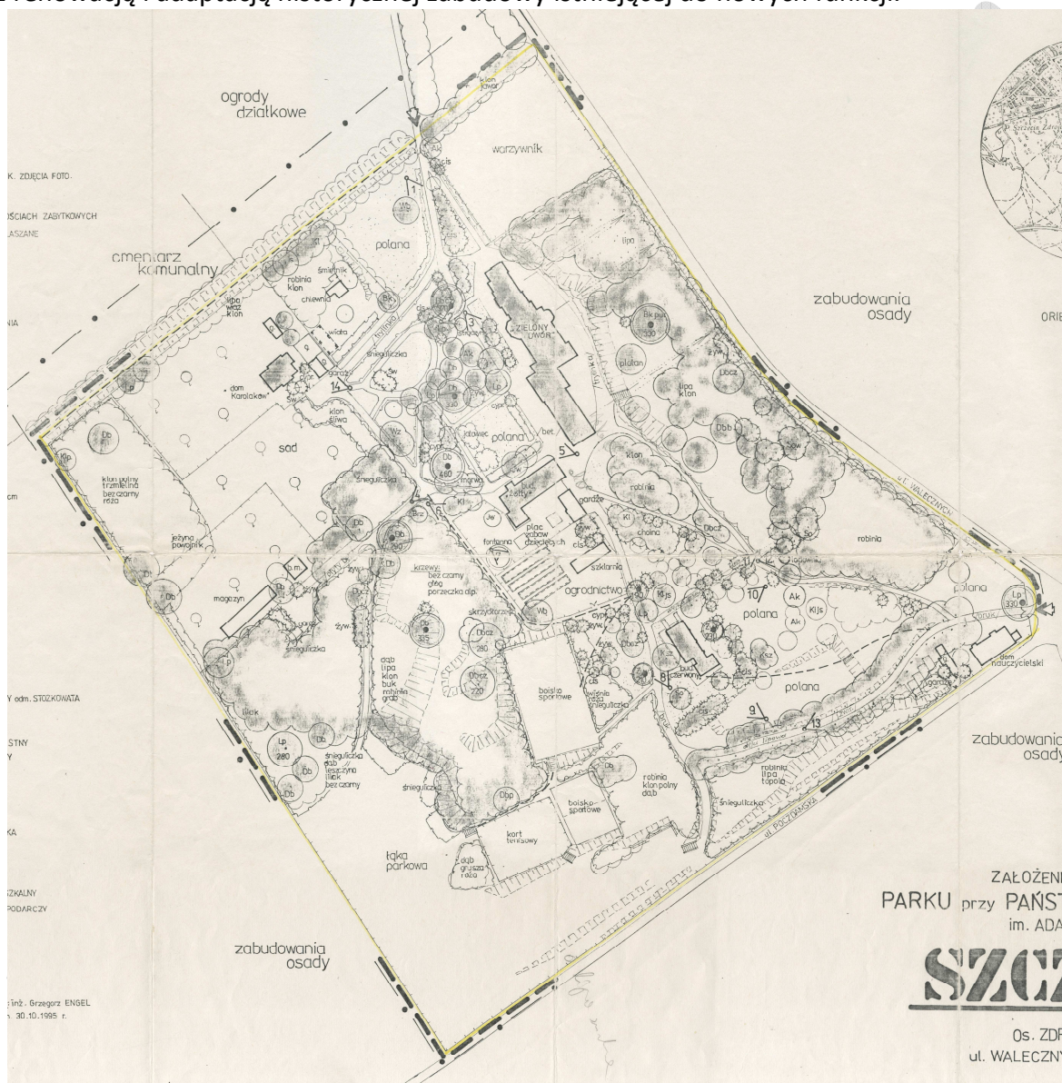
Rysunek.1 Plan założenia przestrzennego założenia dworsko-parkowego Zielony Dwór (Dokumentacja ewidencyjna założenia z 1995 roku)

W granicach obszaru planu znajduje się obiekt wpisany do rejestru zabytków województwa zachodniopomorskiego (pod nr 907): założenie architektoniczno – parkowe dawnego domu sierot w Zdrojach przy ul. Walecznych 23. Ochronie podlega historyczne zagospodarowanie terenu, w tym: kompozycja i skład zieleni parkowej oraz budynki: „Zielony Dwór”, „Dom Karolaków”, „budynek żółty”, „budynek czerwony” i dawna lodownia. Niezbędna jest kompleksowa rewaloryzacja terenu założenia parkowego wraz z renowacją i adaptacją historycznej zabudowy istniejącej do nowych funkcji.