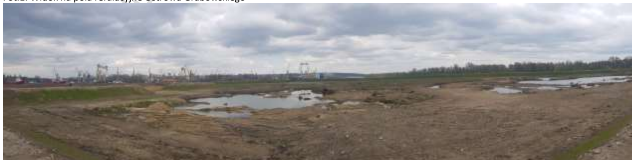
Fot.1. Widok na pola refulacyjne Ostrowa Grabowskiego

Obszar, na którym funkcjonuje ZTUO oraz oczyszczalnia ścieków zagospodarowany i infrastruktura gospodarowania odpadami ze statków jest pokryty pielęgnowaną zielenią niską i nasadzeniami zieleni wysokiej – na terenie ZTUO są to kilkunastoletnie drzewa, natomiast na terenie oczyszczalni drzewa są zróżnicowane wiekowo i gatunkowo (głównie topole, brzozy, świerki).