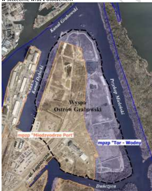
Ryc.1. Obszar planu „Międzyodrze – Ostrów Grabowski” w Szczecinie wraz z otoczeniem