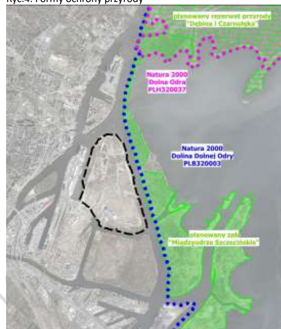
Ryc.4. Formy ochrony przyrody