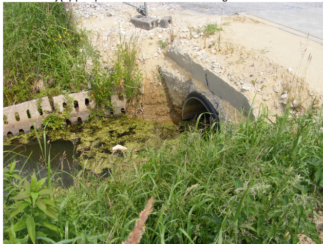
Fot.1. Istniejący przepust na cieku Żołnierska Struga