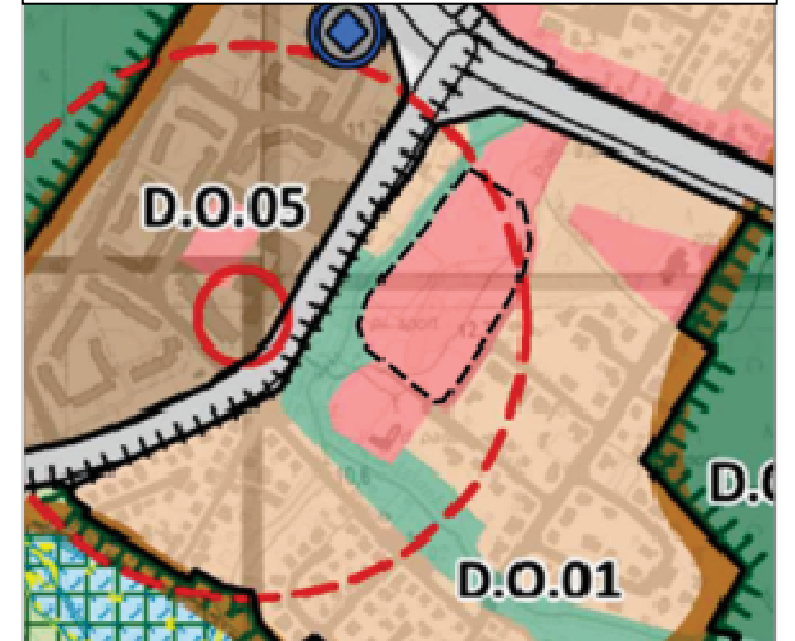
granica obszaru objętego planem